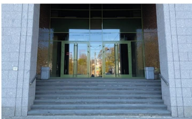
Фото помещения до ремонта (визуализация)